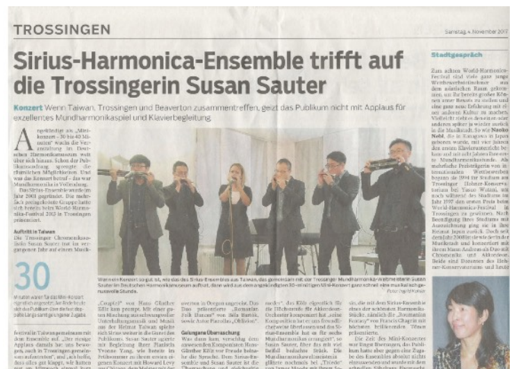
德國當地報紙報導天狼星口琴樂