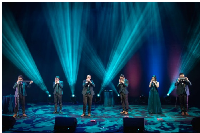
2020年公演台中歌劇院場次演出照片